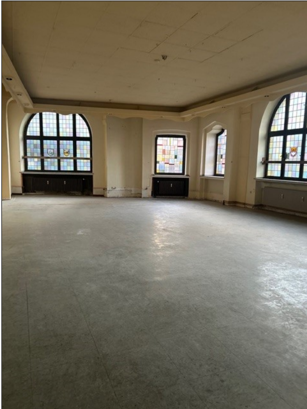
Abbildung 1 Raum Erdgeschoss