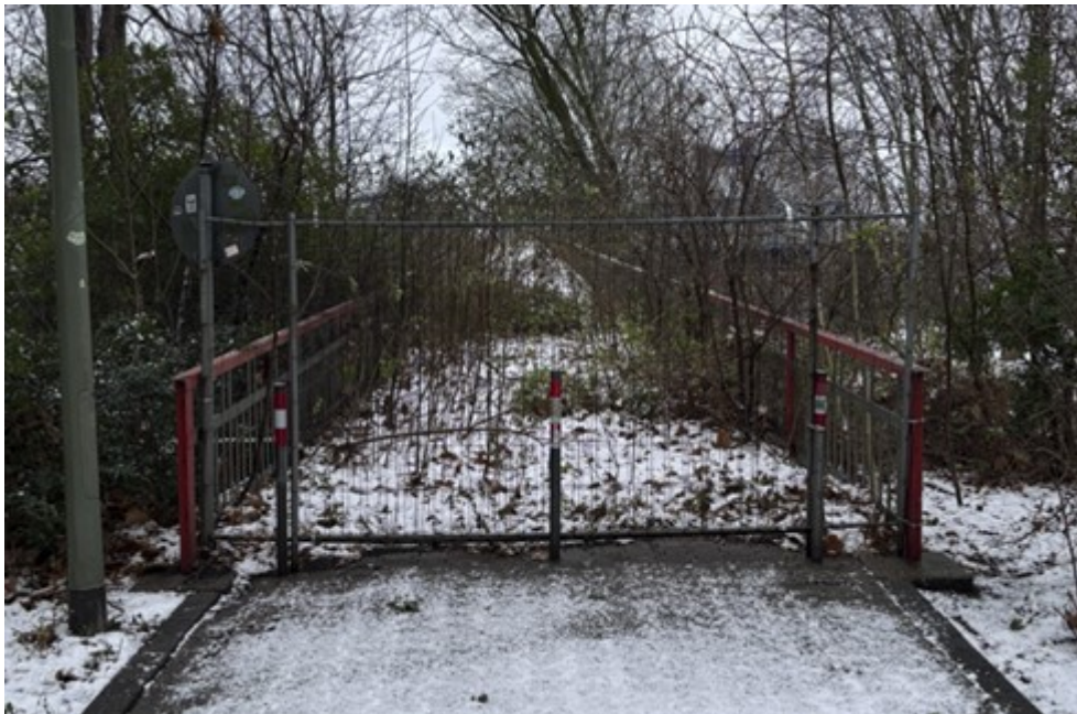
Abbildung 2: Bauzaun vor der Fußgängerbrücke, Zugang zur Brücke über die Königsstraße

Die Fußgängerbrücke ist seit längerer Zeit mit einem einfachen Bauzaun abgesperrt. Die überwuchernden Pflanzen lassen die Umgebung verwahrlost wirken. Die Beantwortung der oben gestellten Fragen soll dazu beitragen, Ideen zu entwickeln, um das Ortsbild zu verschönern.